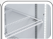
Lampe LED interne verticale