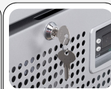
Serrure montée de série